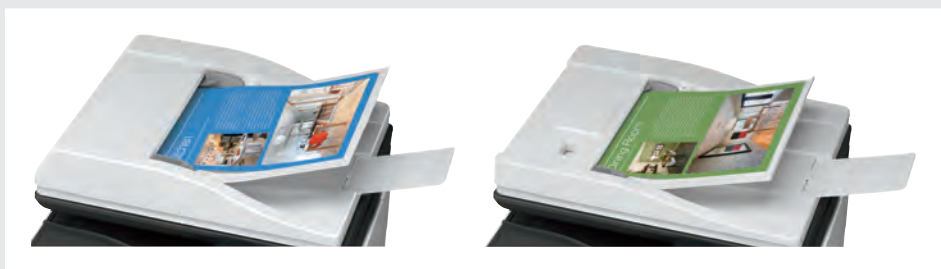
ALIMENTATORE DEGLI ORIGINALI