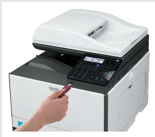
PORTA USB FRONTALE

Entrambi i modelli hanno in dotazione una comoda porta USB per stampare e scansare facilmente da una chiavetta. Inoltre, puoi connettere MX-C300W a una rete wireless e stampare direttamente dal tuo smartphone o tablet.