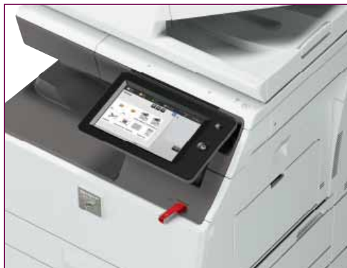
Inserisci la tua USB e inizia a stampare o ad acquisire.

Un'unità hard disk (HDD) integrata da 500 GB consente di archiviare documenti voluminosi e complessi, cui si può accedere rapidamente grazie al sistema di archiviazione documentale. Per la massima praticità, la tecnologia Office Direct Print di Sharp* ti permette di stampare qualsiasi documento senza dover nemmeno usare il PC. Ti basta avvicinarti alla MFP, inserire una chiavetta USB contenente immagini, file Adobe PDF o Microsoft® Office e stampare ciò che desideri. Oppure puoi acquisire e salvare rapidamente i documenti direttamente sulla USB.