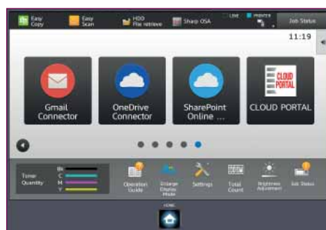
Connessione diretta a servizi di cloud pubblici e Cloud Portal Office.

Diminuisce anche il rischio di dimenticare documenti importanti o sensibili dove chiunque possa vederli. Grazie alla funzione Print Release puoi inviare un lavoro da stampare e, quando sei pronto, avvicinarti alla stampante più comoda, accedere e stampare le informazioni.