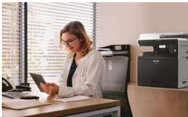
Un complemento elegante per qualsiasi spazio/ufficio.

Non occorrono cavi né configurazioni complesse. Una wireless LAN opzionale consente di collegarti a qualsiasi servizio WiFi, in modo che chiunque possa stampare o acquisire direttamente dal proprio smartphone, tablet o PC utilizzando AirPrint, Google Cloud Print o l'app Sharpdesk Mobile. Oppure inserire una chiavetta USB e selezionare un file dal menu a comparsa per stampare direttamente qualsiasi documento archiviato o salvare le scansioni senza utilizzare un computer.